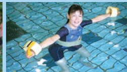
マジックフローター