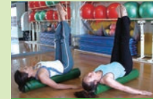
ボールストレッチ