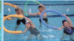
各種アクアダンス