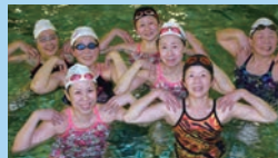
肩こり腰痛改善運動